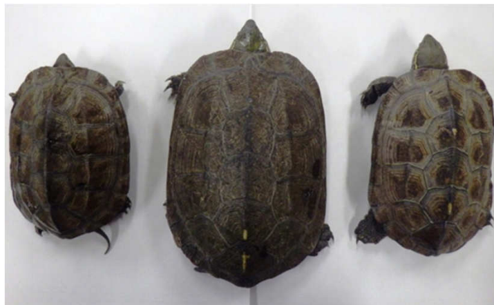
図1. 2014年8月に壱岐島で捕獲した3匹のクサガメ