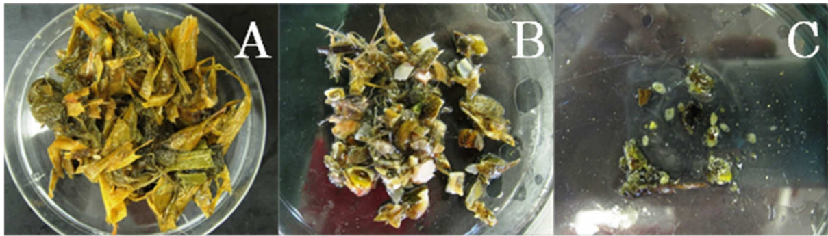
図1. 捕獲されたカメの消化管内容物

A: アカミミガメ(背甲長211.6mm・新川) 大部分が植物質であった. B: スッポン(背甲長216.1mm・新川) 甲殻類や貝類が多い. C: クサガメ(背甲長135.4mm・仲勝湧水池) 植物質が確認された.