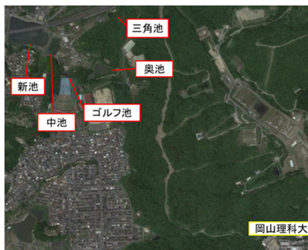
図1. 調査地

調査期間は2014年5月18日～9月20日、捕獲はカメ用罠にアジ、オオナゴなどの餌をいれて、3から10時間後に引き上げた. 捕獲したカメは種・性を確認し、背甲長(CL; Carapace Length)と体重を計測した. また、密度の指標としてCPT(Catch per Trap; 谷口・亀崎, 2011)を用いた.